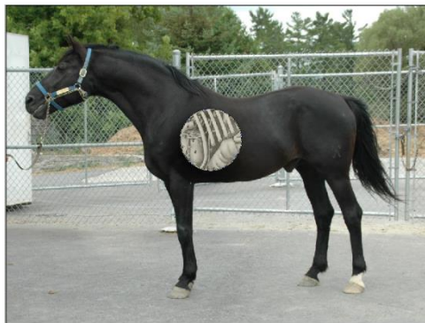
Abbildung 3: "Pferd.psd"

Man kann diese Funktion vielfältig nutzen. Beispielsweise ist es möglich, in einem bearbeiteten Bild teilweise die Originalfarben zum Vorschein kommen zu lassen. Der Kreativität sind keine Grenzen gesetzt.